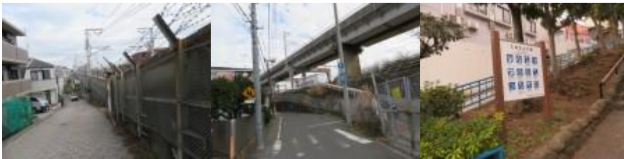
※たぬき山公園への路