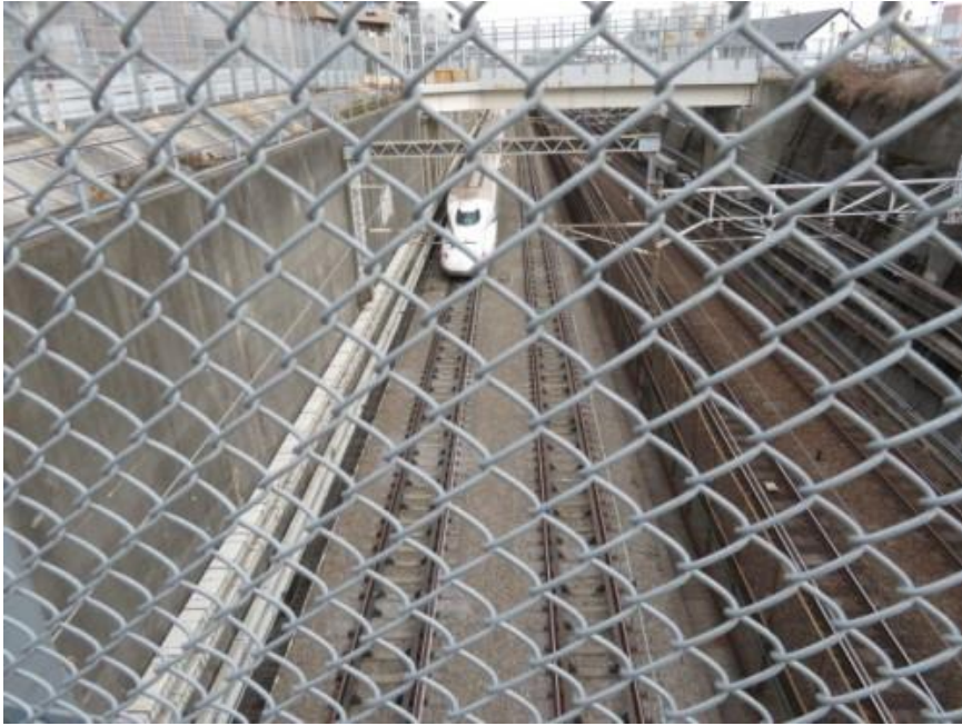
※土豪を走る新幹線！！在来線と線路幅異なる