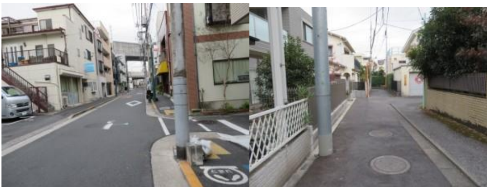
※くねくねした路地を歩く