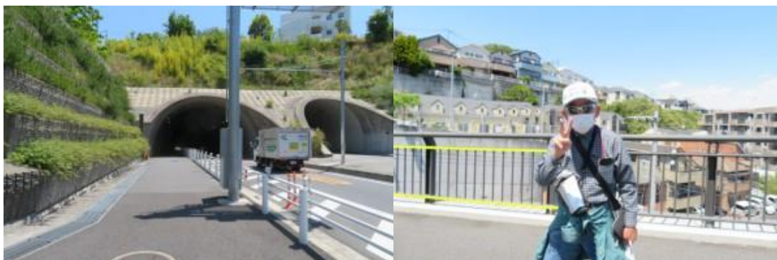
※岸谷生麦トンネル、横浜住宅街を背後に

した歩道が続く。流石、横浜と感じた。12時7分、東海道本線、横須賀線、京浜東北線、横浜線、京急線の線路を跨ぐ。道なりに歩いた先に本日の終着駅の生麦駅があった。この駅は、立命館神川校友会の新年会の会場（養老の瀧）があった場所で、何度も1月に足を運んだ。ただし、コロナの影響もあり、本日残念ながらその姿は民家となっていた。ただし、2次会で何度かお邪魔した朱鷺はあった。