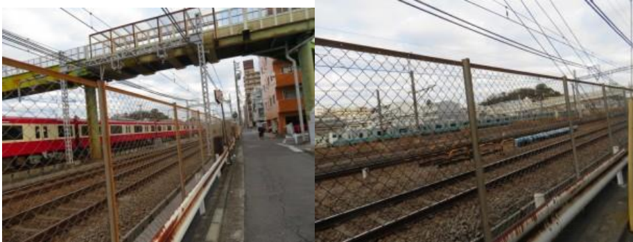
※京急線の花月総持寺駅を目指して