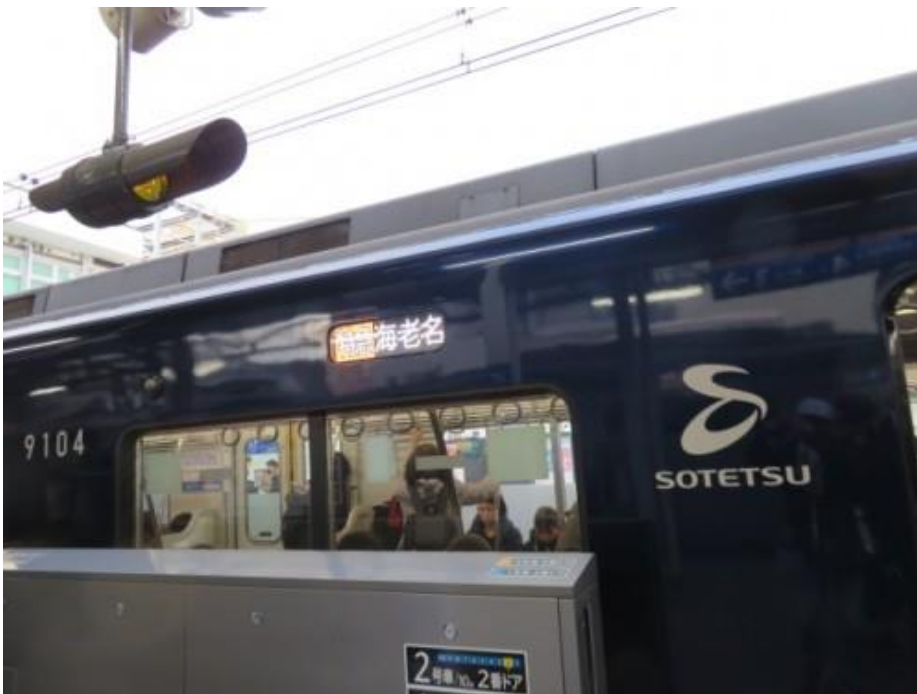
※西谷駅で特急海老名行きに乗り換える