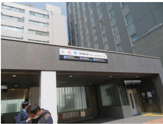
※相鉄新横浜駅、東急新横浜駅