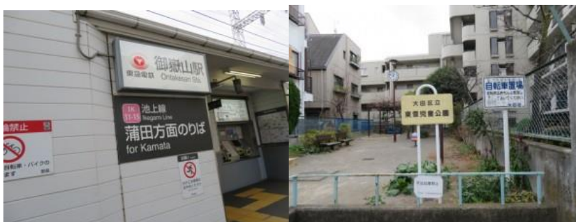
※東急池上線の御嶽山駅、大田区立東雪児童公園