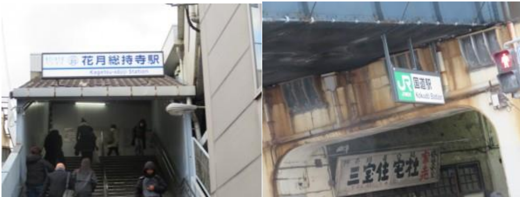
※花月総持寺駅、鶴見線の国道駅