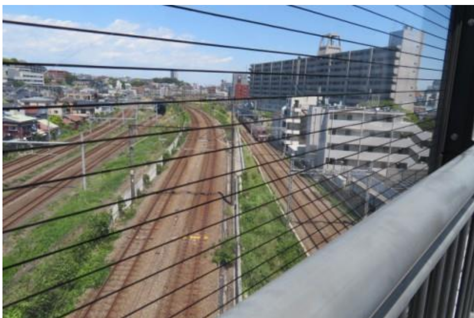
※沢山の路線を跨ぐ