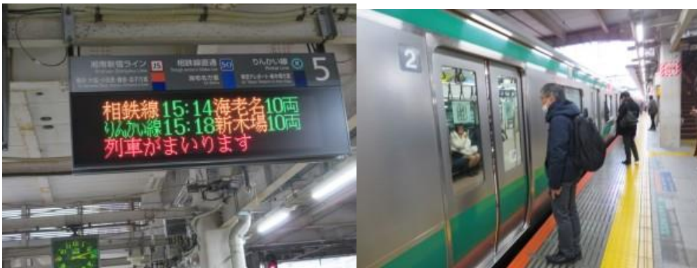
※15時14分発の海老名行きに乗車

⑦大崎 15時14分発の相鉄海老名行きに乗り、拡張の東海道本線を活用し、羽沢横浜国大駅経由で自宅を目指す。運よく、西谷駅で特急の接続があり、大和駅には15時58分到着。小田急線とバスも上手く連結しており、自宅には16時22分到着。相鉄線の拡張路線の利便性を肌で強く感じた一日となった。同時に何事も最後までやり抜き整理整頓することは、重要であると強く感じた一日となった。特に、帰りの電車は、本日歩いた場面をダイジェスト版で振り返りえることができ感動する。日帰りの旅とはいえ、旅は良いものですね。