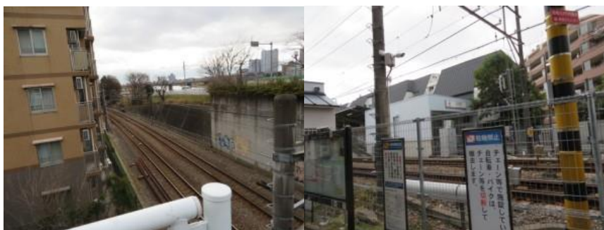
※京急多摩川線、沼部駅

富士見橋で土豪を走る新幹線写真の撮影に成功する。13時23分、馬込橋を通過。13時31分、蛇坂界限を通過。くねくねした路地を歩き、13時39分、急な坂に沿って、たぬき山公園前があった。ここからも再度くねくねした路地を歩く。何度も袋小路に遭遇し、引き返しを余儀なくされる。13時48分。いつの間にか在来線と新幹線が交差して、歩く方向からの順番が変わっていた。13時55分、新幹線が高架となり、その下を在来線が走るポジションとなる。14時7分、やっと西大井駅に到着する。それにしても、武蔵小杉駅から西大井駅は難解な道筋であった。