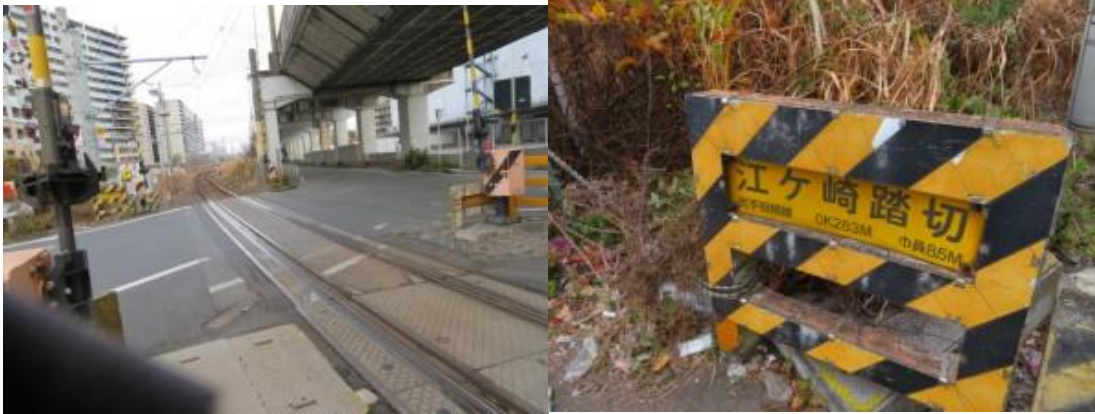
※東海道本線の線路、江ヶ崎踏切を横切る