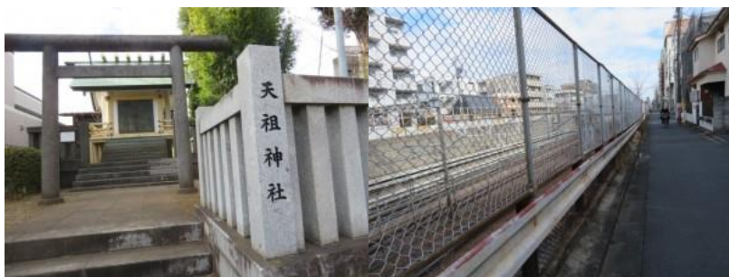
※天祖神社を經由し、JR線路脇に出る