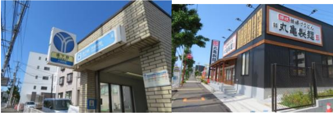
※片倉町駅、丸亀製麺

③しかし、片倉町駅から岸根公園への道筋を誤る。岸根公園と反対の三ツ沢上町駅方面に向かっていた。何となく変だと思い、犬を散歩させている人に聞いて大正解。案の定誤っていた。30分位ロスタイムが生じるが、地元の人お蔭で、水道道沿いにある岸根公園に10時13分到着できる。水道道は私の故郷発祥の丸亀製麺を曲がった先にあった。ウォーキングの醍醐味を味わうことができる。この辺りに岸根公園駅があるとのことであつたが、私の記憶には残念ながら100%消失していた。記憶というのは実に怪しいものだと思つて痛感する。岸根公園には親子連れの人々の姿があり、ゴールデンウイークのひとつ時を楽しんでいた。