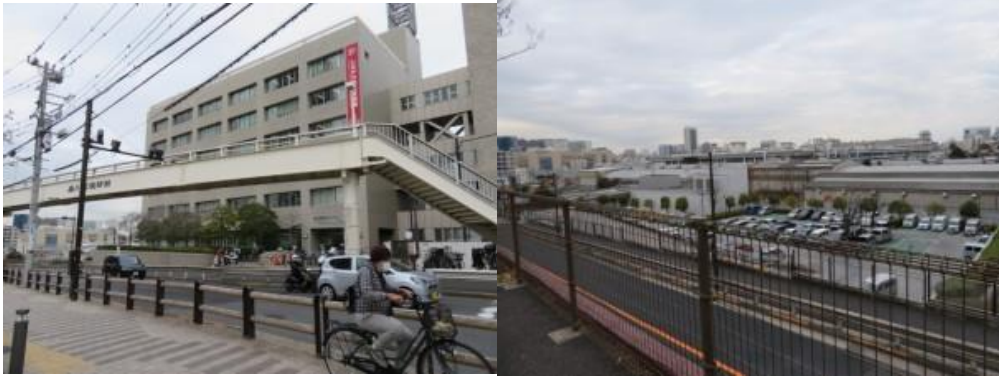
※品川区役所、品川駅界隈が一望